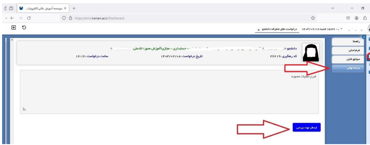
تصویر شماره شش

- به منوی "مرحله نهایی" رفته و کلید "ارسال جهت بررسی" را انتخاب نمایید.