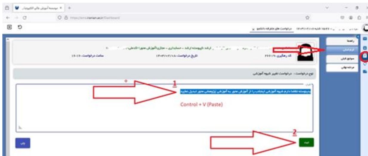
تصویر شماره پنج

- متن کپی شده را در منوی "فرم اصلی" قسمت "شرح" جایگزین نمایید.